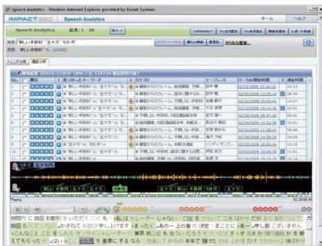
「Impact 360 SA」メイン画面(例)

通話音声の定量・可視化は、人手で行うと膨大な工数を要し、実態把握・改善へ進めるまでに時間がかかる。Impact 360 SAを導入したことで、従来なら数カ月を要していた実態把握を数週間に短縮でき、改善のスピードアップを実現できるようになった。2013年4月に導入し、現在(同年12月)は改善活動の効果検証を進めている段階だ。今後は業務改善だけでなく、顧客の声(VOC)分析から市場ニーズを把握するなどマーケティング領域への活用も視野に入れている。